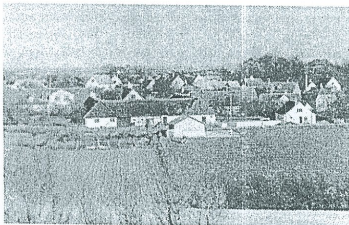
Gadekæret, klubhuset, fodboldbanen og Kjærgården set fra Bøgebjerg.

når det gælder forhold langt fra Brundby.