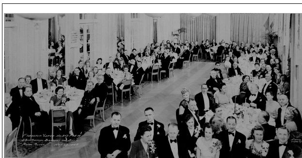
Billedet, der rejser frem og tilbage over Atlanten

I foreningens samling af billeder befinder sig et stort sort/hvidt billede med teksten ” Frederik Lodge 857, 2nd Annual Banquet and Ball, Hotel Aster, New York, November 27 1948.