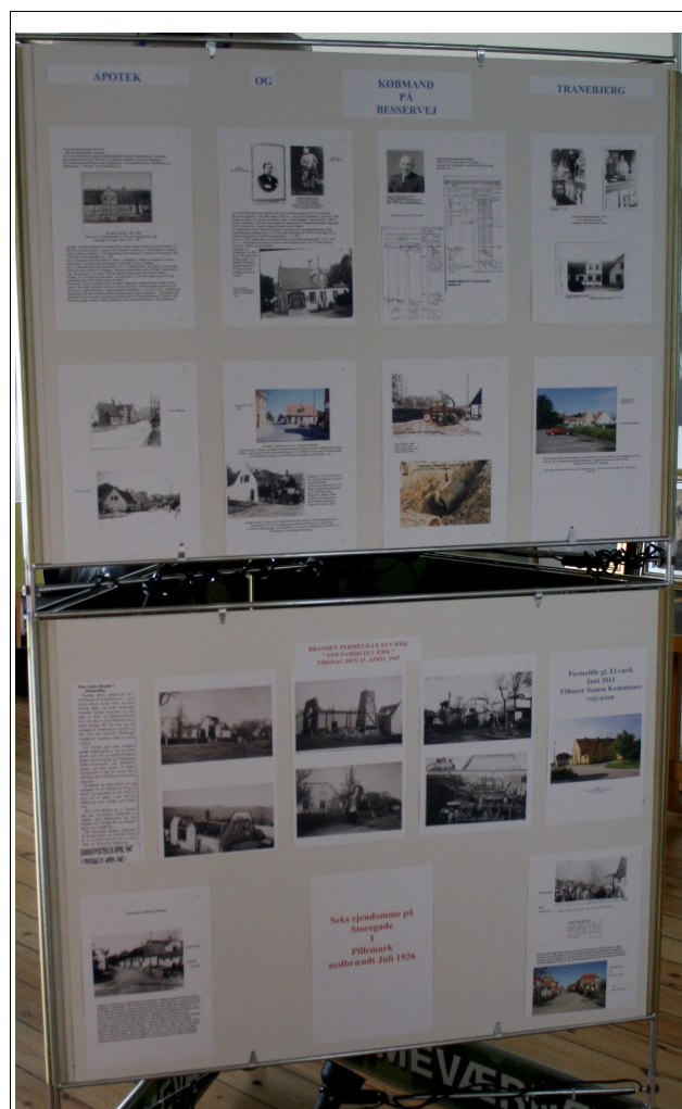
Fra plancheudstillingen i Medborgerhuset

Og der kommer heldigvis masser af positive bemærkninger til dette gode initiativ, og især når personer eller steder genkendendes. Plancherne skiftes ca. hver anden måned og vi har heldigvis masser af ubrugt karton.